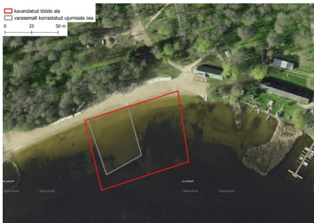
Joonis. Kuremaa järve ujumikoha asukoht (allikas: KMH aruanne).